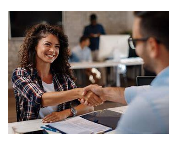
Finding a job (int + ext)