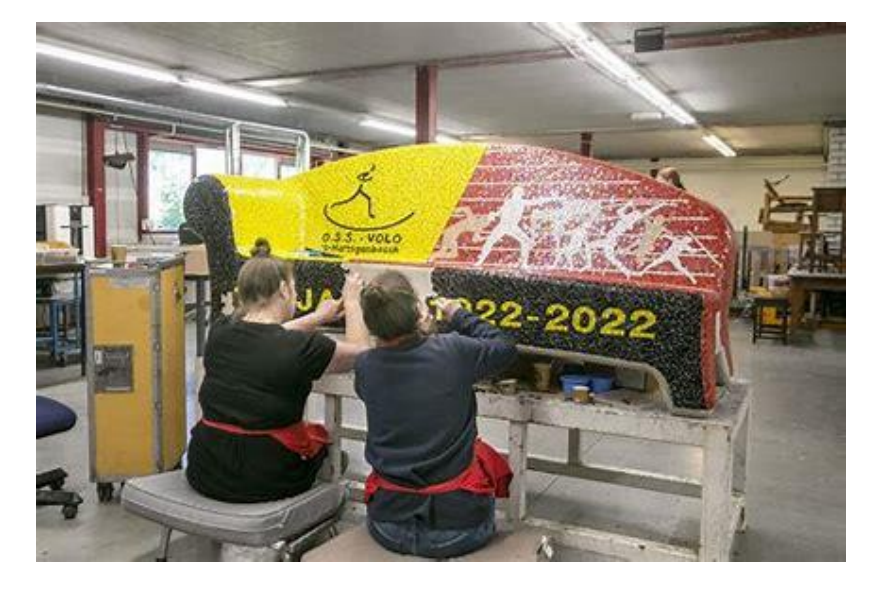
Work-related daytime activities