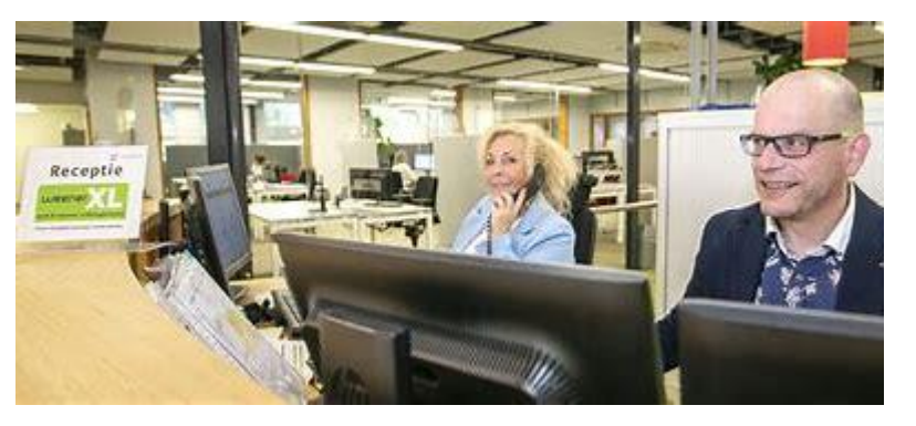
Counterwork, Administration & facility