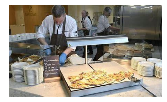
Catering company canteen